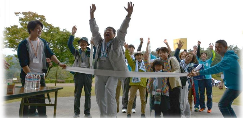
グループごとにゴールしました！