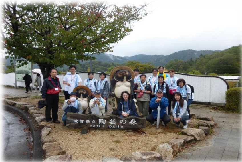
雨も小康状態に。みんなで記念撮影📷