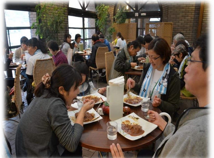
昼食 鶏肉と五穀米のヘルシーカレー 美味しかった♡ カフェレストラン大小屋にて