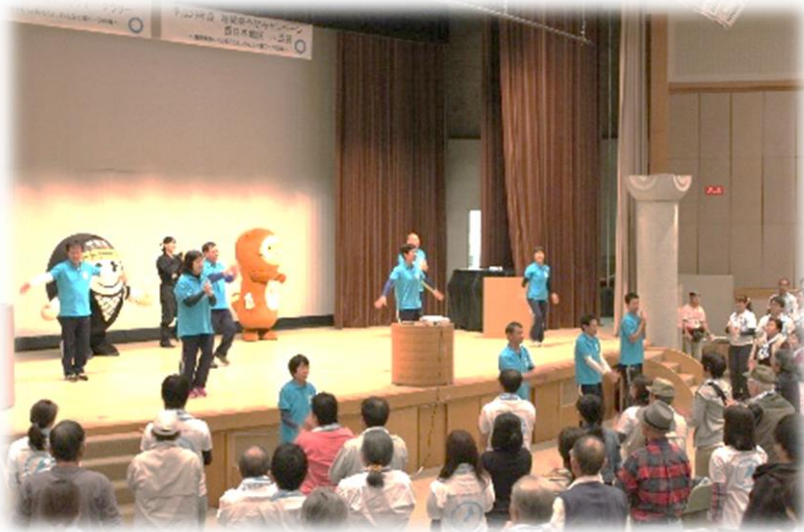
準備体操「世界で一つだけの体操」 (甲賀市スポーツ推進委員)