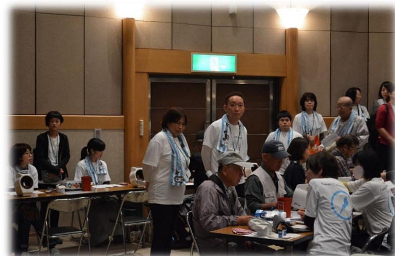
会場内 血糖血圧測定コーナー